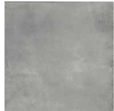
Color: Light Grey.