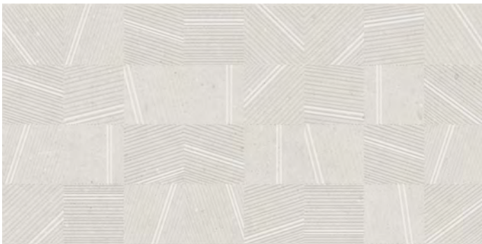
Beige Caras: 1