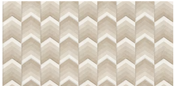
Deco Caras: 1