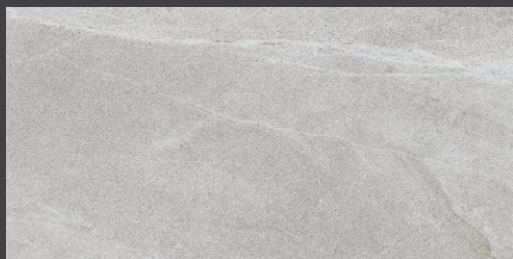
Blanco ZS51 77 X 153 cm rectificado