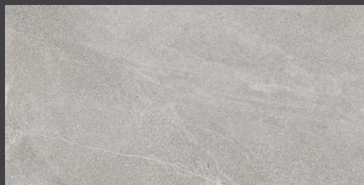
Gris ZS52 77 X 153 cm rectificado