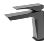
ACABADO · Negro mate.