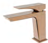
ACABADO · Rose gold.