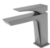
ACABADO · Gun grey.