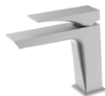
ACABADO · Niquel.