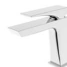
ACABADO · Cromado.