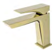
ACABADO · Gold.