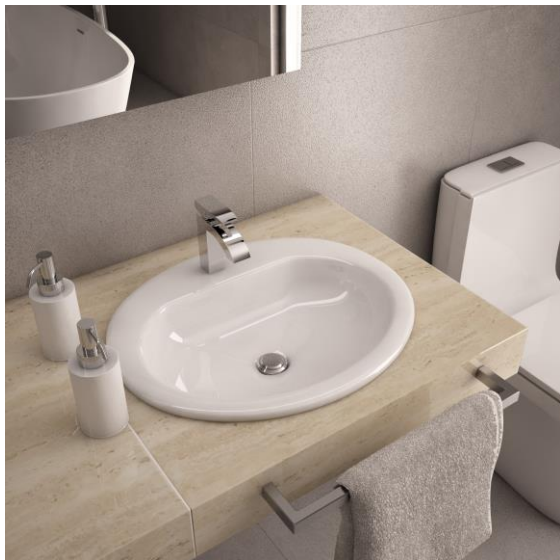
Imagen referencial del producto