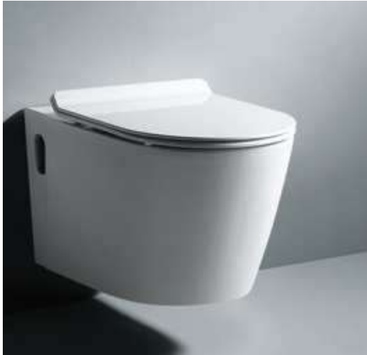
Imagen referencial del producto