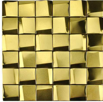
Dorado - 29.5*29.5