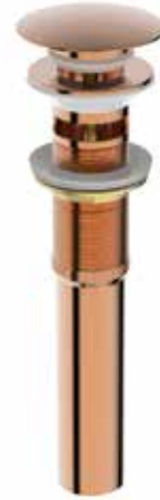
02. | Acabado Rojo