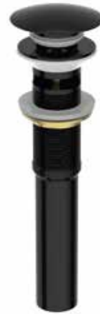
04. | Acabado Negro BR