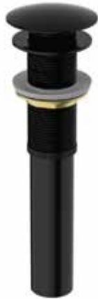
05. | Acabado Negro Mate