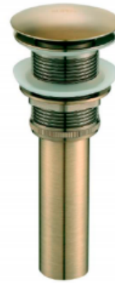
06. | Acabado Bronce