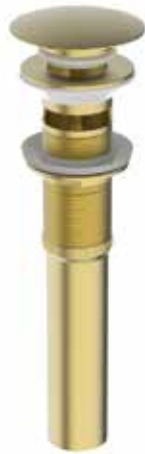
03. | Acabado Dorado