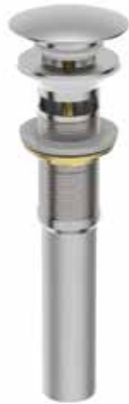
01. | Acabado Níquel