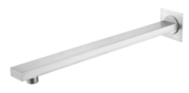
ACABADO · Nickel.