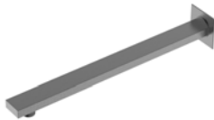
ACABADO · Gun grey.