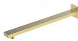
ACABADO · Gold