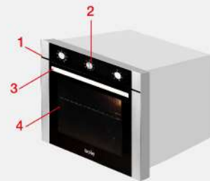
DIAGRAMA DE INSTALACIÓN