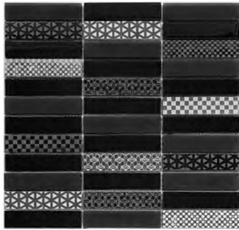
Black - 30*30 cm